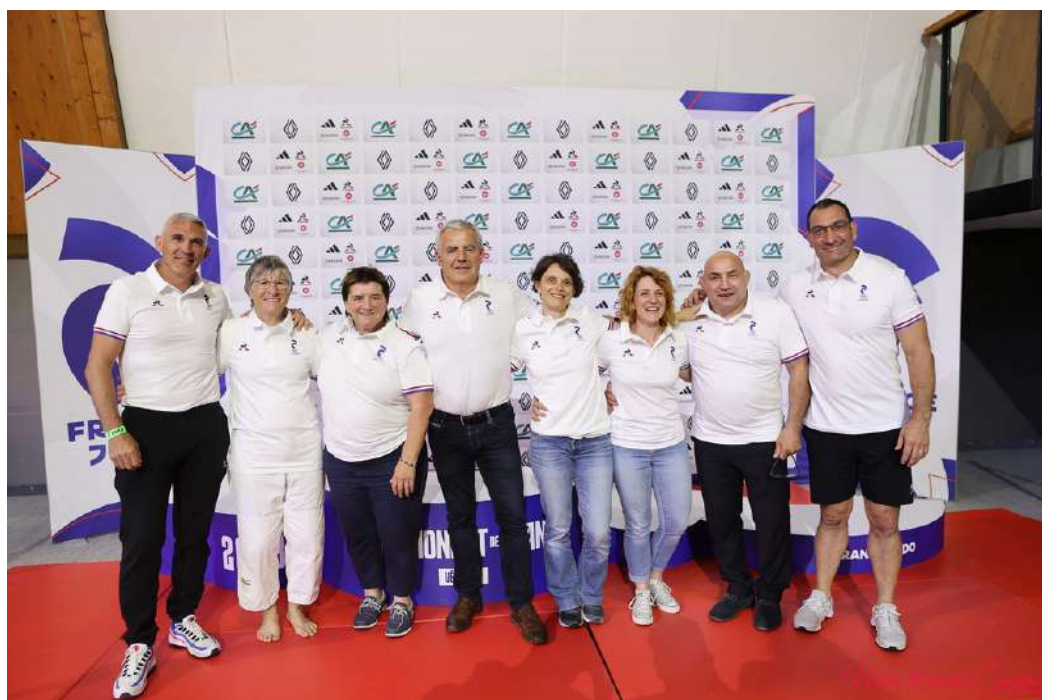
Membres du GT présents au Championnat de France Vétérans 2023