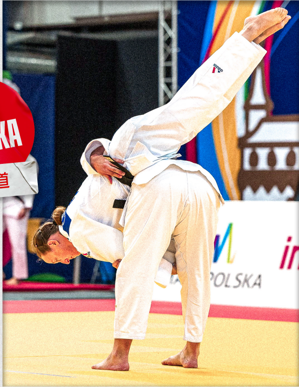
CHAMPIONNAT DE FRANCE