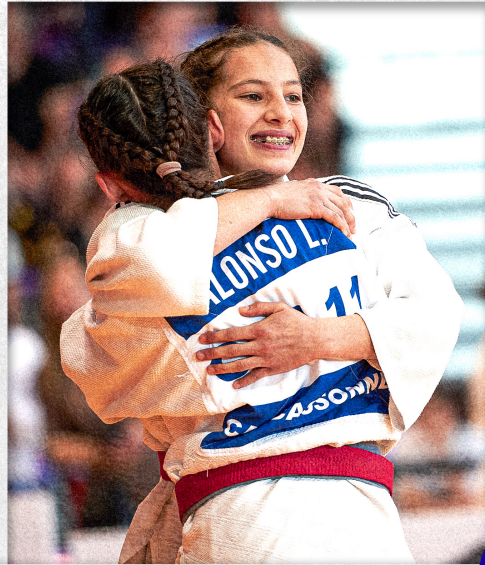
COMPLEXE SPORTIF RENE-TYS