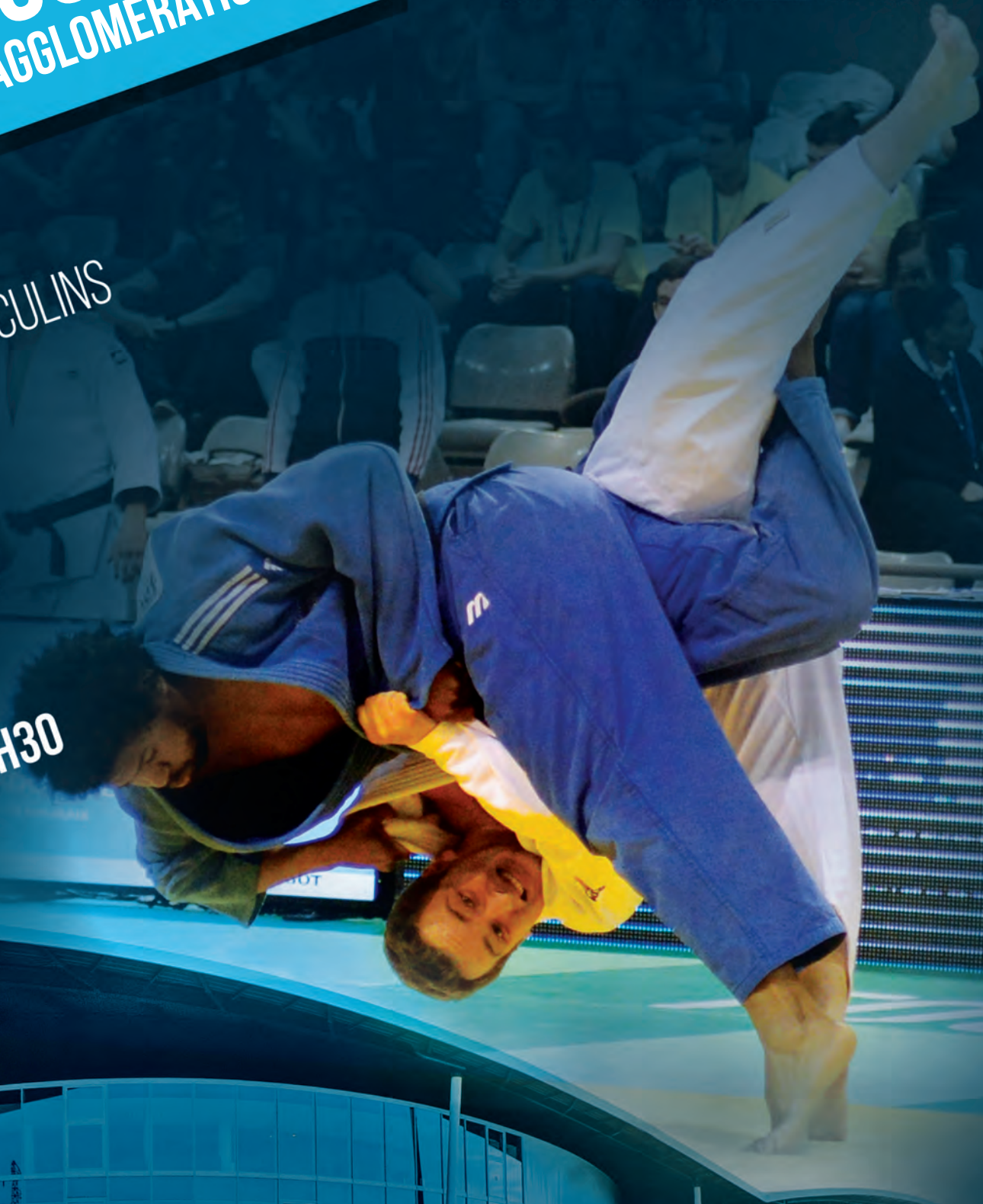
Réalisation: Amenothès Conception - www.amenothès.com