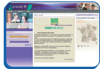
L'accord du salarié est nécessaire pour utiliser le chèque associatif

Le centre adresse au salarié : • une attestation d'emploi, qui vaut bulletin de salaire, à l'issue de chaque période d'emploi;