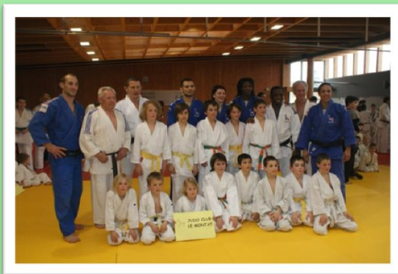
Photos de groupes