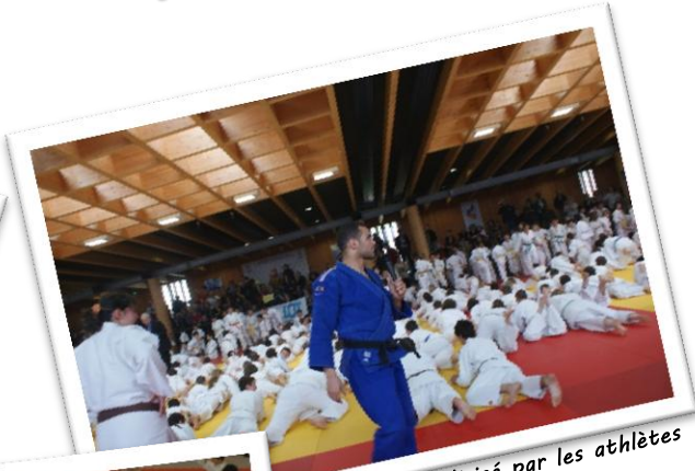
Echauffement dirigé par les athlètes