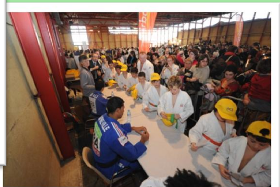
Séance de dédicaces