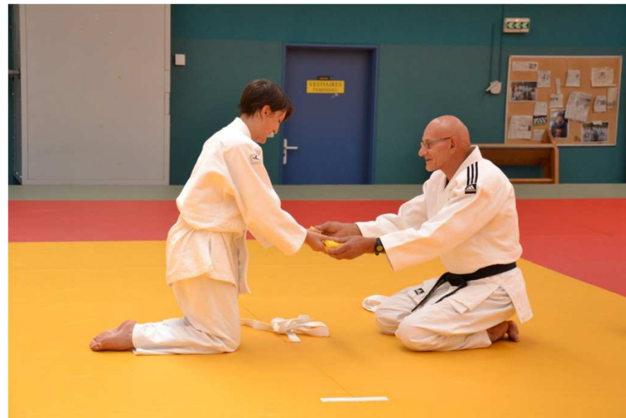
Remise de ceinture, juin 2011