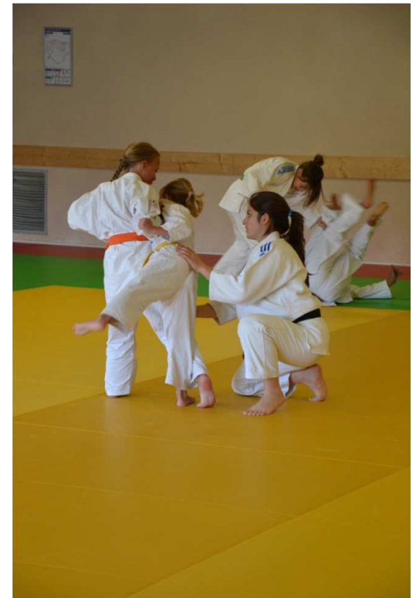
Doubs, dimanche 23 octobre 2011