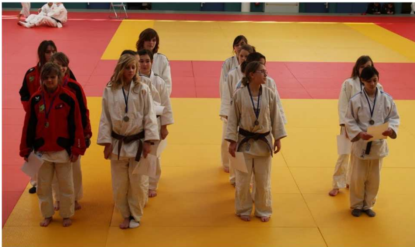
4 équipes ont participé au championnat

Dimanche 19 décembre 2010 Valorisation des féminines par une remise de trophées