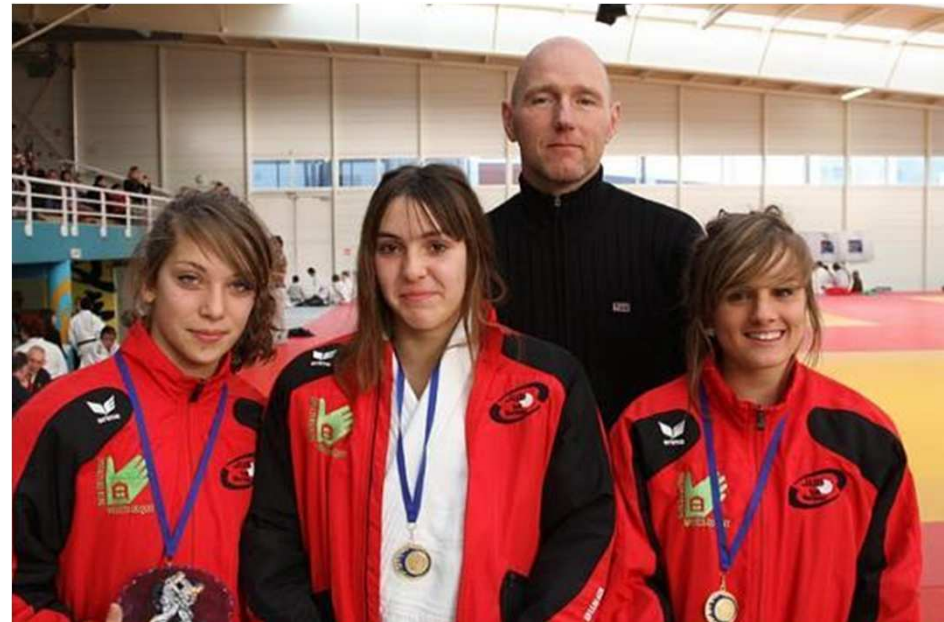
Les filles du Judo Val de Morteau ont remporté la première place