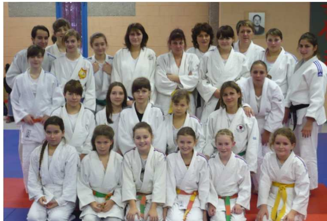
Vesoul, samedi 5 février 2011.